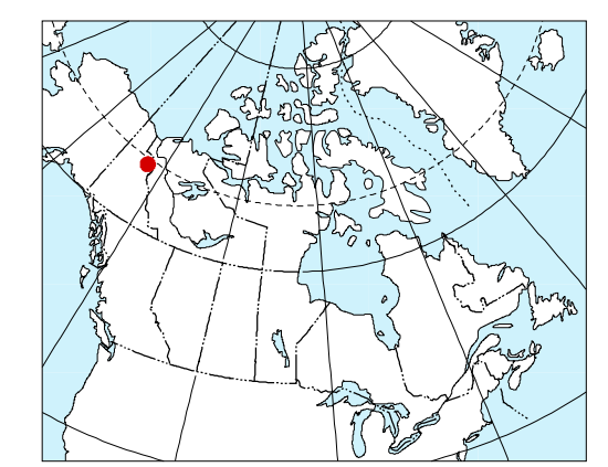
MAP LOCATION / LOCALISATION DE LA CARTE

Recommended citation: Klas F., Coyte M., Forté S., Dumont R. Geological Survey of Canada 2003 Aeromagnetic Total Field 106 E/SE-SW, Yukon Territory, Geological Survey of Canada, Open File 1538 Exploration and Geology Services Canada, Yukon Region, Indian and Northern Affairs, Open File 2003-1, Scale 1:100 000. Notation bibliographique conseillée: Klas F., Coyte M., Forté S., Dumont R. Commission géologique du Canada 2003 Carte aéro-magnétique du champ total 106 E/SE-SW, Territoire du Yukon, Commission géologique du Canada Dossier public 1538 Affaires indiennes et du Nord canadien, Région du Yukon, Exploration et services de géologie, Dossier Public 2003-1, Échelle 1/100 000.